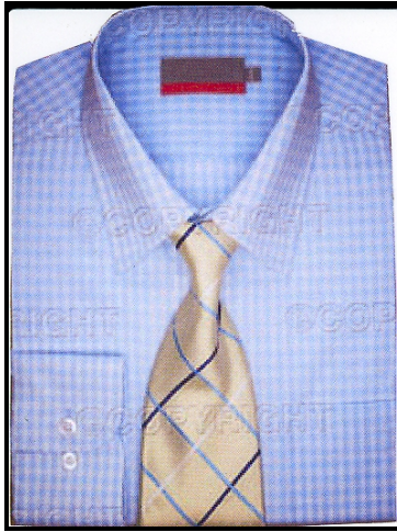
FIGUUR 1: Hemp