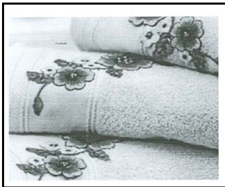
FIGUUR 3: Geborduurde handdoeke