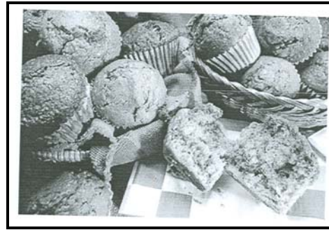
FIGUUR 2: Varsgebakte muffins